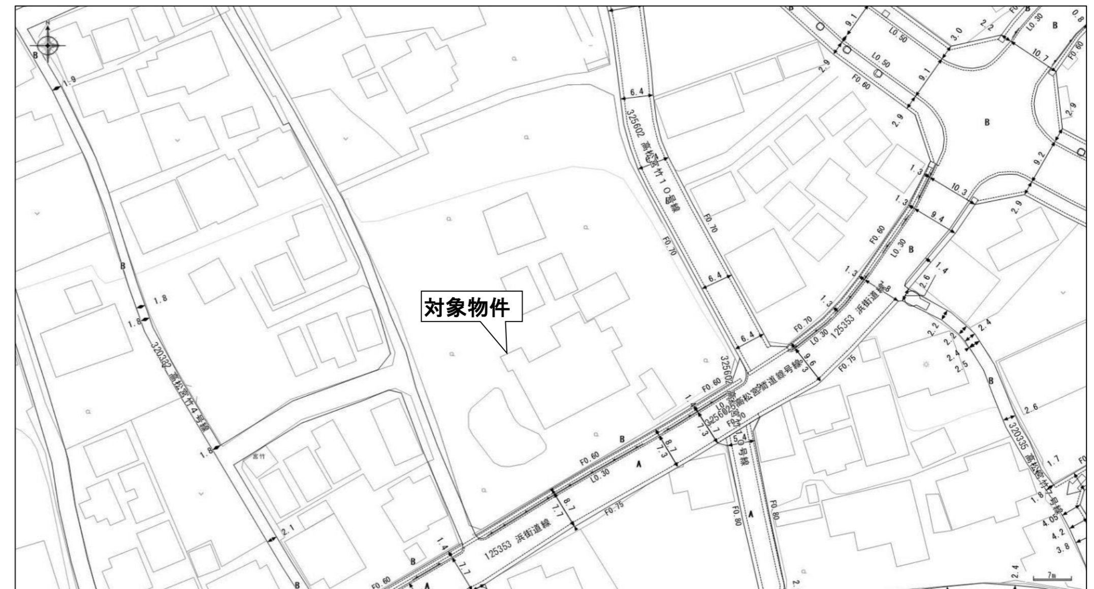
静岡市地図情報インターネット提供サービス：道路台帳図情報から引用